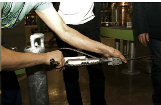
Turvatrossi paigaldamine kinnititele ja lõpp-pingutamine