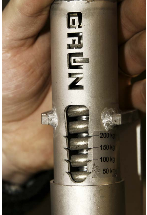
Trossi pinguti väärtus peab skaalal jääma 50–100 vahele (tavaliselt 80), siis on pingutus õige.

Juhuslike kontrollimatute toodete paigaldamine turvavarustuse nime all on täiesti lubamatu. Turvavarustuse külge kinnitatakse inimesi ja kontrollimata toodete kasutamine võib viia fataalsete tagajärgedeni.